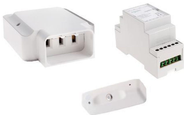
ARGUS KVKIT Tavle montert komfyrvakt. Krever nærhet til sikringsskap og ledig kapasitet. (minimum 4 moduler) Ferdig installert pris: 3 990,-