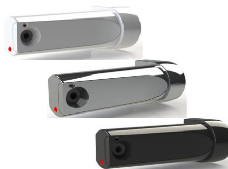
MKOMFY 25 2G Komfyrvakt med design sensor Ferdig installert pris: 4 990,-