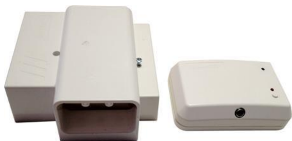
MKOMFY 25R Standard komfyrvakt. Ferdig installert pris: 3 990,-

Prisene gjelder ved bytte av vanlig komfyr kontakt til komfyrvakt